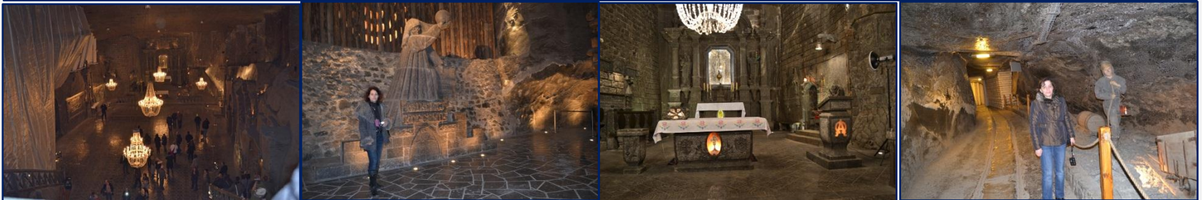
“Wieliczka” – The Salt Mine