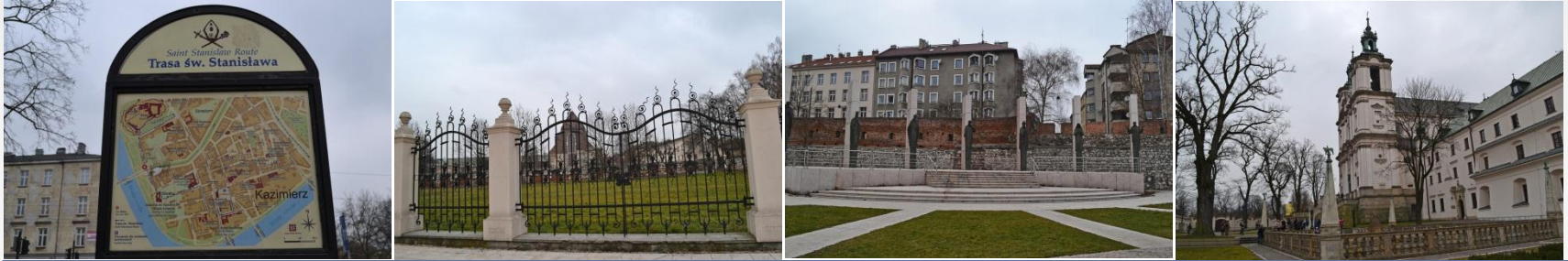
“Kazimierz” – Yahudi Senti