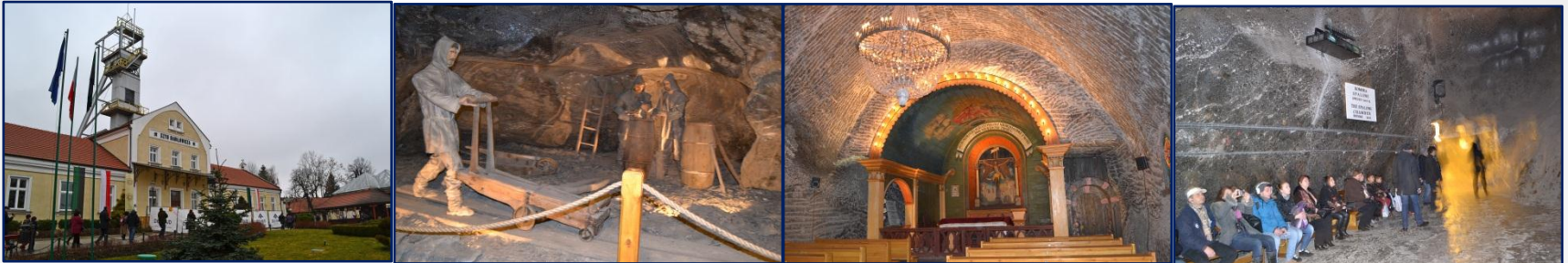
“Wieliczka” – Tuz Madeni