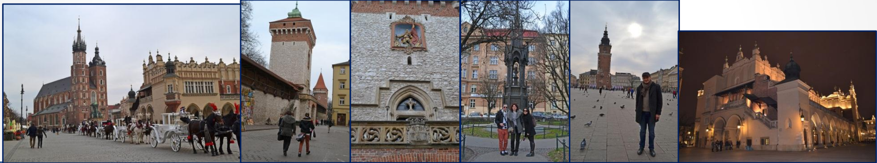
Krakov- Tarihi Merkez